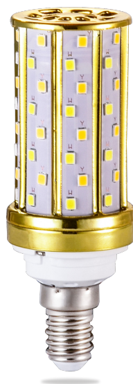
FOCO CORN TRICOLOR